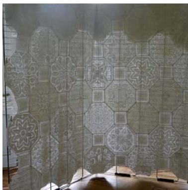
1 er prix : Saga Michèle MENORET 2.40 x 2.40 m