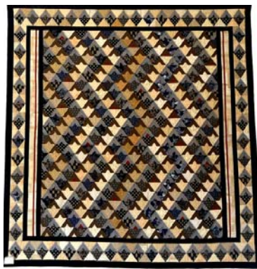
2 e prix : Japon Isabelle GROSJEAN 2,40 x 2,40m