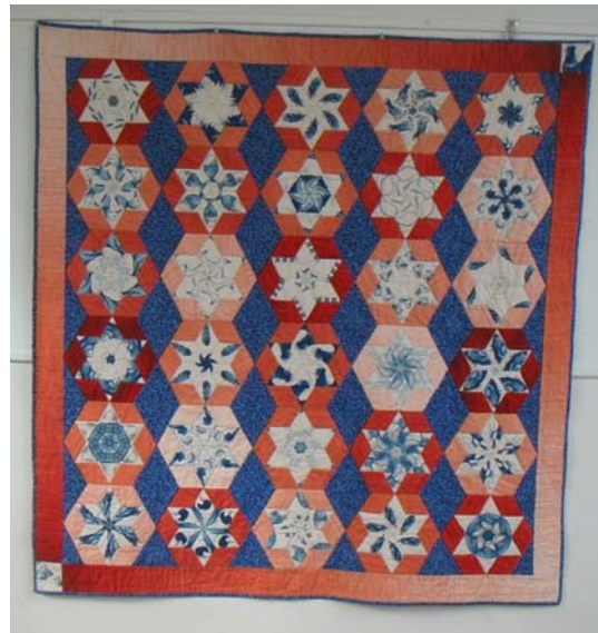
Etoiles tournantes : Marie-Lou

Il ne restait plus, à chacune, qu'à les disposer et les monter de manière originale. Le plus petit ouvrage terminé faisait 70 cm, le plus grand 1m20, suivant la taille choisie pour l'étoile, et suivant le montage.