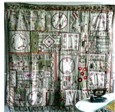
3 e prix : A petites points, maman et moi Sylvie SELLA – 1.56 x1.51 m