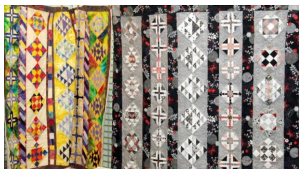
Vos quílts mystères