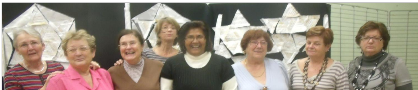
Les heureuses gagnantes